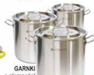
GARNKI o pojemności od 12L do 50L cena już od 175 90