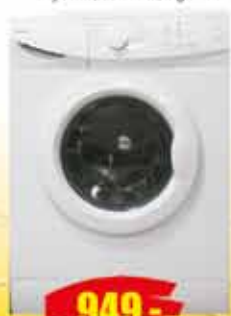
PRALKA AMICA klasaA+ wsad 6kg, 1000 obr./min wys.85, szer.59,5 gl.47