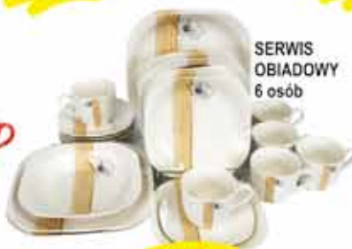
SERWIS OBIADOWY 6 osób