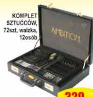
KOMPLET SZTUĆCÓW, 72szt, walzka, 12osób