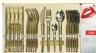
KOMPLET SZTUĆCÓW 6 osób 114 99