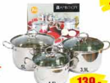
KOMPLET GARNKÓW 6 elementów 139,-