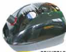
ODKURZACZ ZELMER „EH”