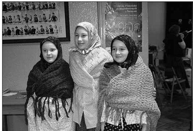
fol. Z archiwum