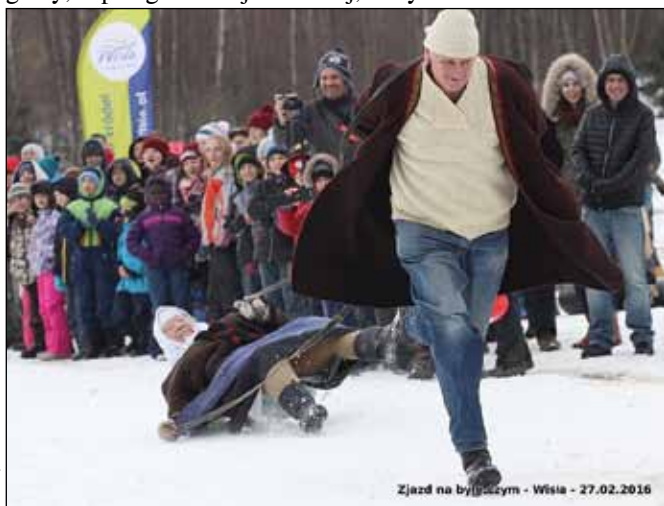
Zjazd na byle czym - Wisła - 27.02.2016