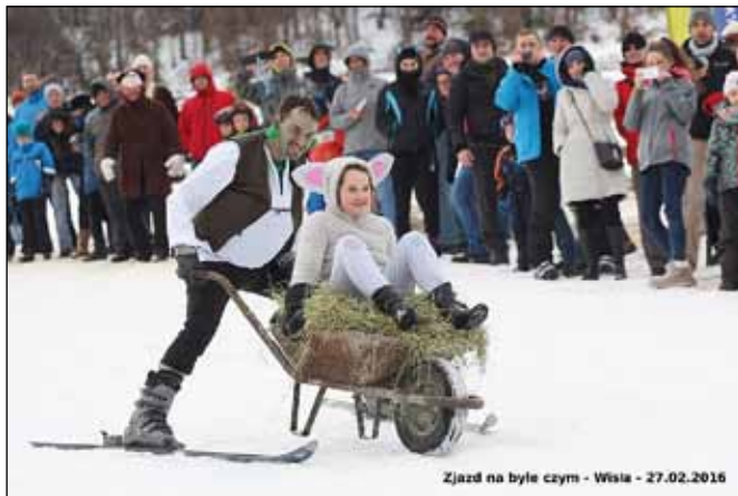
Zjazd na byle czym - Wisła - 27.02.2016