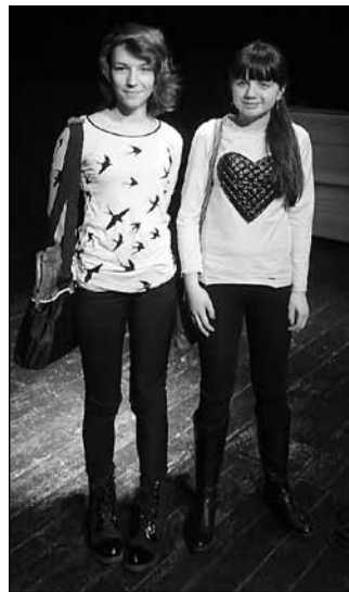
fol. SOM im. J. Drozda