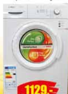
PRALKA BOSCH klasaA+ wsad 5,5kg, 1000 obr./min wys.85, szer.60 gl.55