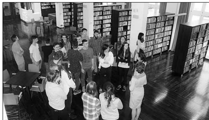
fol. MBP w Wiśle

10 lutego kolejna grupa, tym razem uczniowie klasy IIa Liceum Ogólnokształcącego im. Pawła Stalmacha w Wiśle, zapoznali się z historią biblioteki i budynku Domu Zdrojowego. Okazuje się, że Dom Zdrojowy przyjmował w swe progi ważne osobistości ze świata literatury, filmu i kultury, a spośród polityków gościł w nim m.in. prof. Ignacy Mościcki – Prezydent Rzeczypospolitej Polskiej przed II wojną światową.