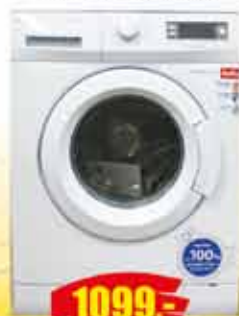
PRALKA AMICA klasaA+ wsad 5kg, 1000 obr./min wys.85, szer.59,5 gl.55