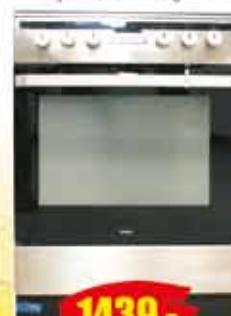
KUCHNIA AMICA gazowo-elekt. klasaA 8 funkcji piekarnika wys.85, szer.60, gl.60