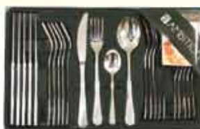
KOMPLET SZTUĆCÓW 6 osób 110 90