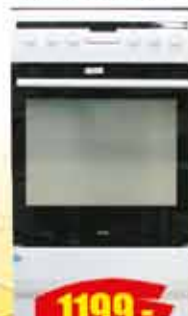
KUCHNIA AMICA gazowo-elekt. klasaA++ ruszt żeliwny, grill wys.85, szer.50, gl.60