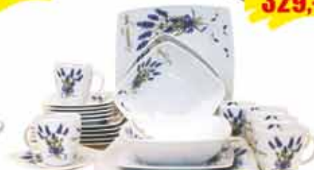
SERWIS OBIADOWY LUBIANA 6 osób