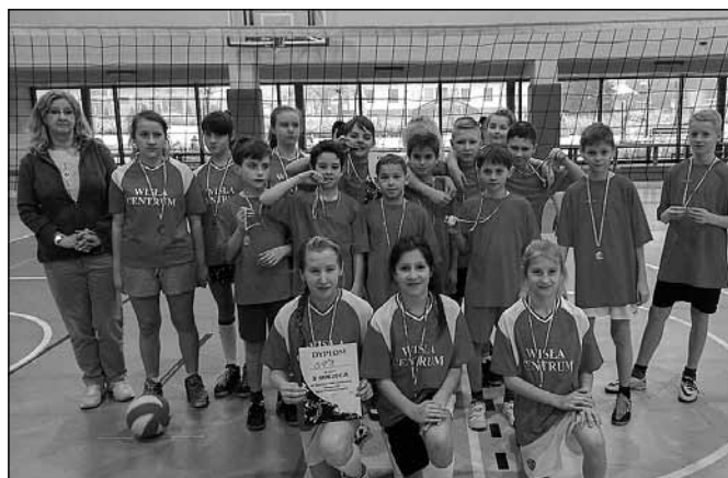
fol. Szkoła Podstawowa nr 1

Wśród dziewcząt najlepsza okazała się reprezentacja Zespołu Szkolno-Przedszkolnego nr 1 w Głębcach. Na drugim stopniu podium stanęła drużyna Zespołu Szkolno-Przedszkolnego nr 2 w Malince, a na trzecim zespół ze Szkoły Podstawowej nr 1 w Centrum. Wśród chłopców podium wyglądało zgoła odmiennie. Na pierwszym miejscu znalazła się reprezentacja z SP 1, na drugim ZSP 2, a na trzecim ZSP 1.