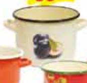
GARNEK, emalia 2L 22 90