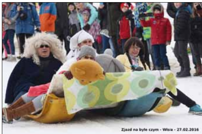
Zjazd na byle czym - Wisła - 27.02.2016