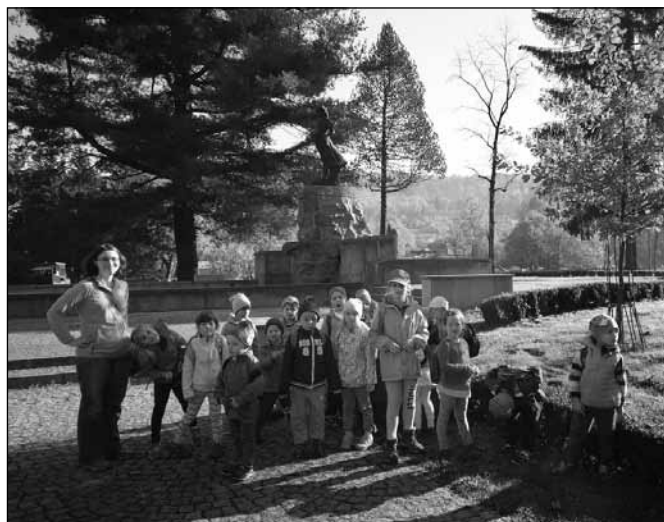
fol. Szkoła Podstawowa nr 2

Trasy XXVI Rajdu Szkoły u Źródeł Wisły biegle w tym roku wzdłuż królowej polskich rzek, a naszą inicjatywę zgłosiliśmy na stronie www.rokwisly.pl . Impreza odbyła się w piękny, słoneczny dzień, 17 października. Uczniowie szkoły zostali podzieleni na dwie grupy. Starsi wraz z wychowawczyniami i przewodnikiem udali się na Baranią Górę niebieskim szlakiem, który prowadzi wzdłuż Białej Wisielki – jednego z potoków źródłkowych rzeki Wisły. Druga grupa wyruszyła w przeciwną stronę. Dzieci młodsze wędrowały wzdłuż rzeki Wisły do centrum miasta, gdzie obejrzały Pomnik Źródeł Wi-