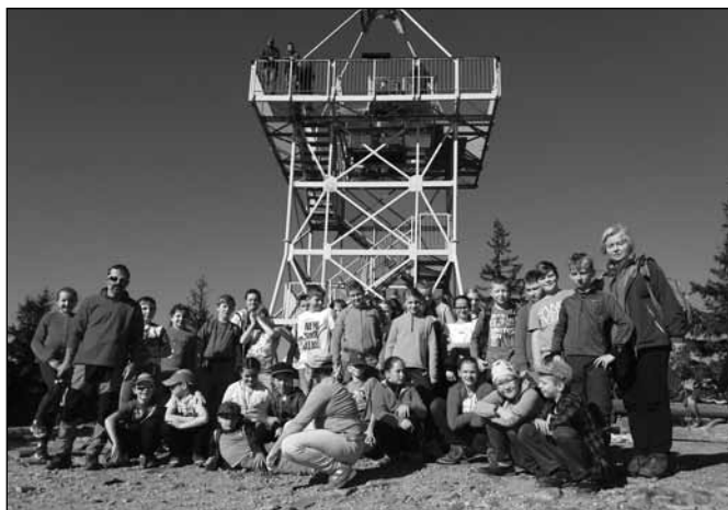
fol. Szkoła Podstawowa nr 2

Podczas podsumowania rajdu uczniowie mogli popisać się wiedzą turystyczną oraz odpowiadali na pytania dotyczące rzeki Wisły. Każda klasa przedstawiła także garść informacji o jednym z miast leżących nad rzeką Wisłą. Na koniec wszyscy uczestnicy rajdu otrzymali na pamiątkę okolicznościowe plakietki. Alicja Pieszka