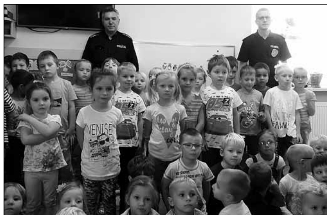
foto. Przedszkole nr 2