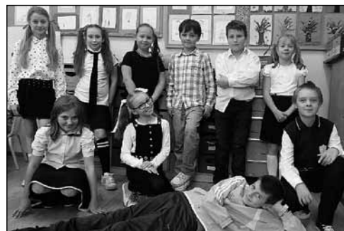
foto. Szkoła Podstawowa nr 1