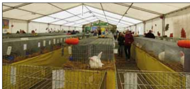
fol. Zarząd OZHZI