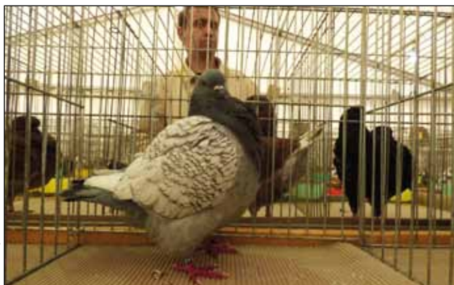
fol. Zarząd OZHZI