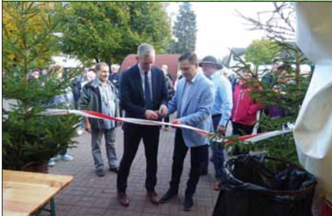
fol. Zarząd OZHD