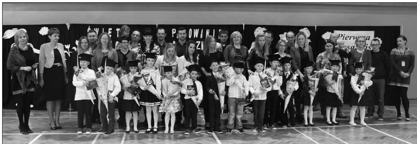
fol. Szkoła Podstawowa nr 5